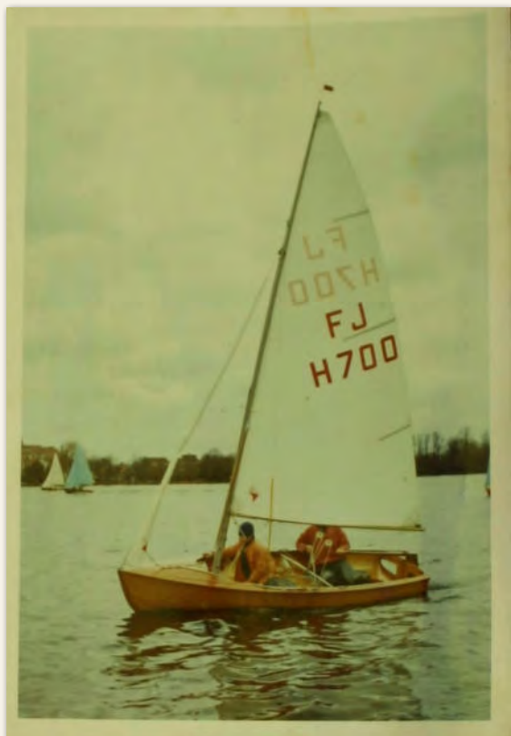
De Flying Junior met eigengemaakt zeil.