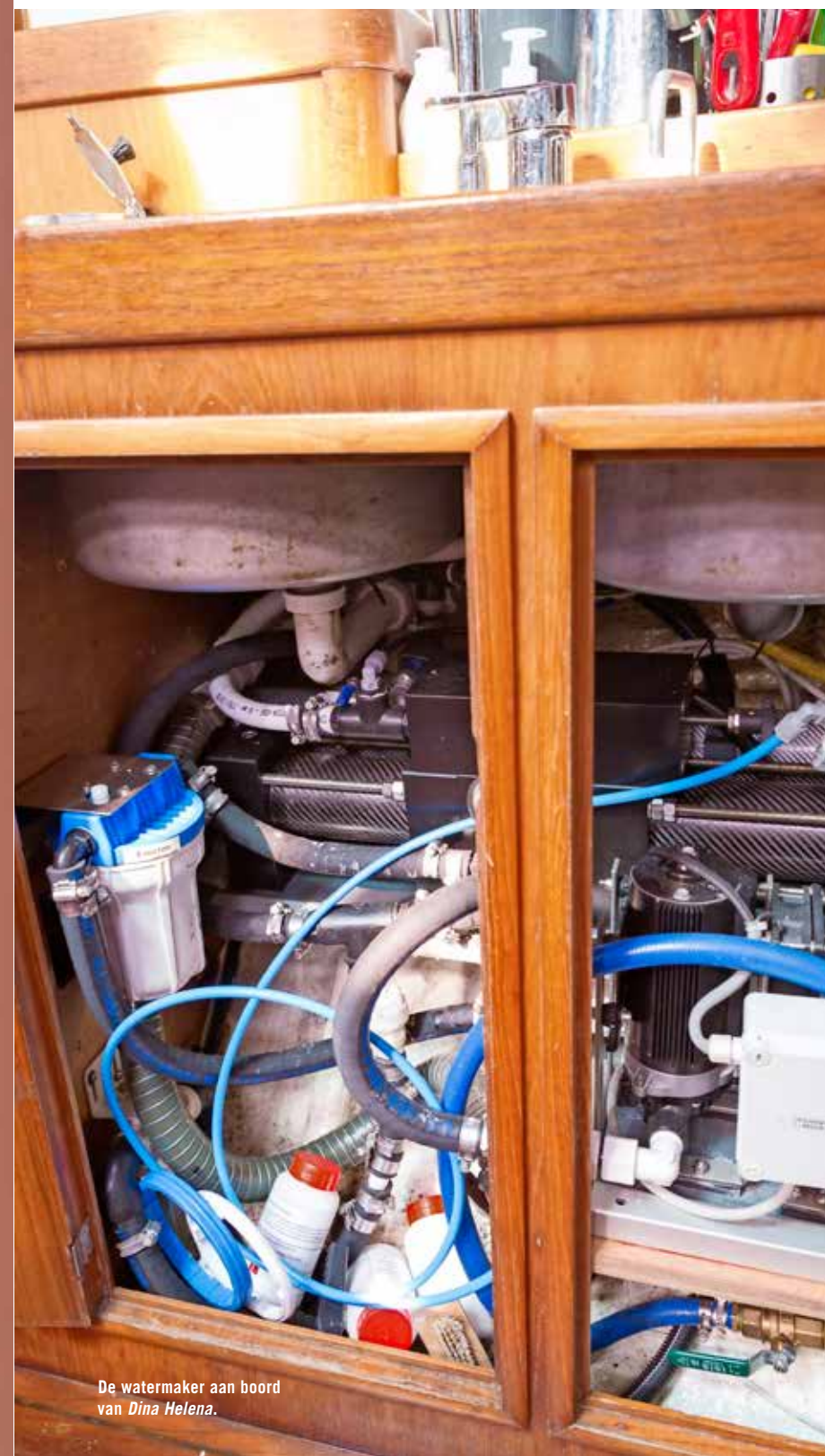
De watermaker aan boord van Dina Helena.