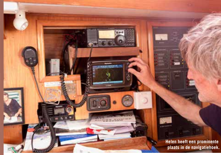
Helen heeft een prominente plaats in de navigatiehoek.