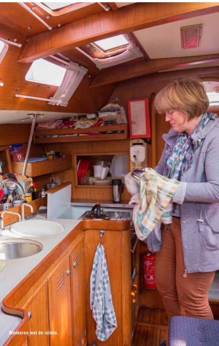
Wekeren met de ruimte.