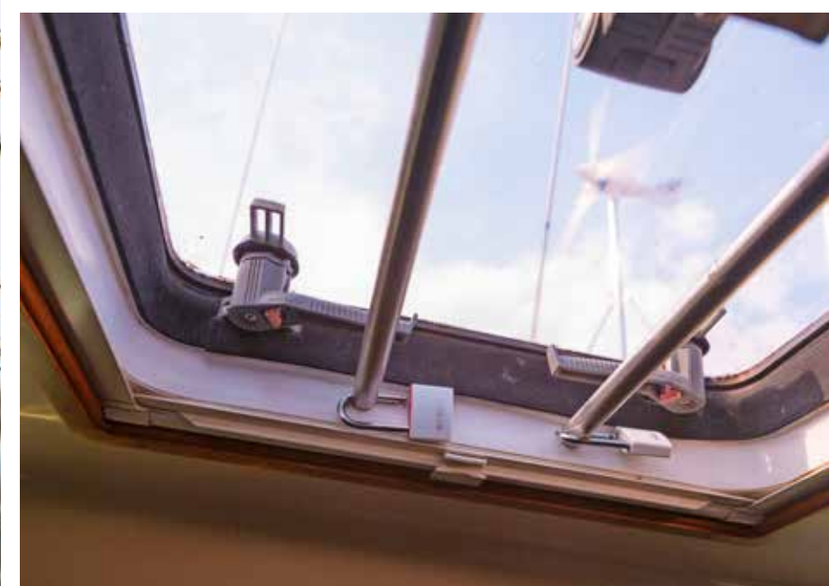
De luiken zijn met tralies beveiligd tegen inbraak.